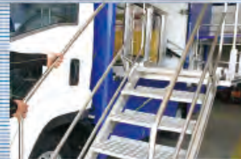
両面手すり階段も安心構造です