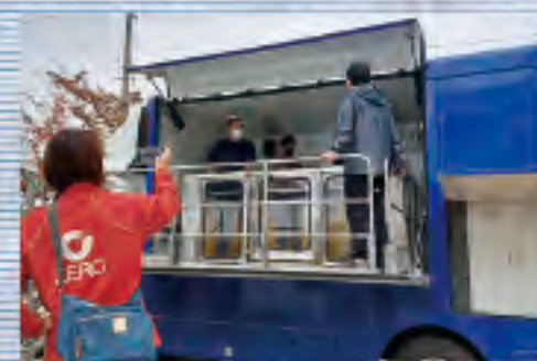
企業様防災訓練や住宅販売会社様イベントにも大活躍します