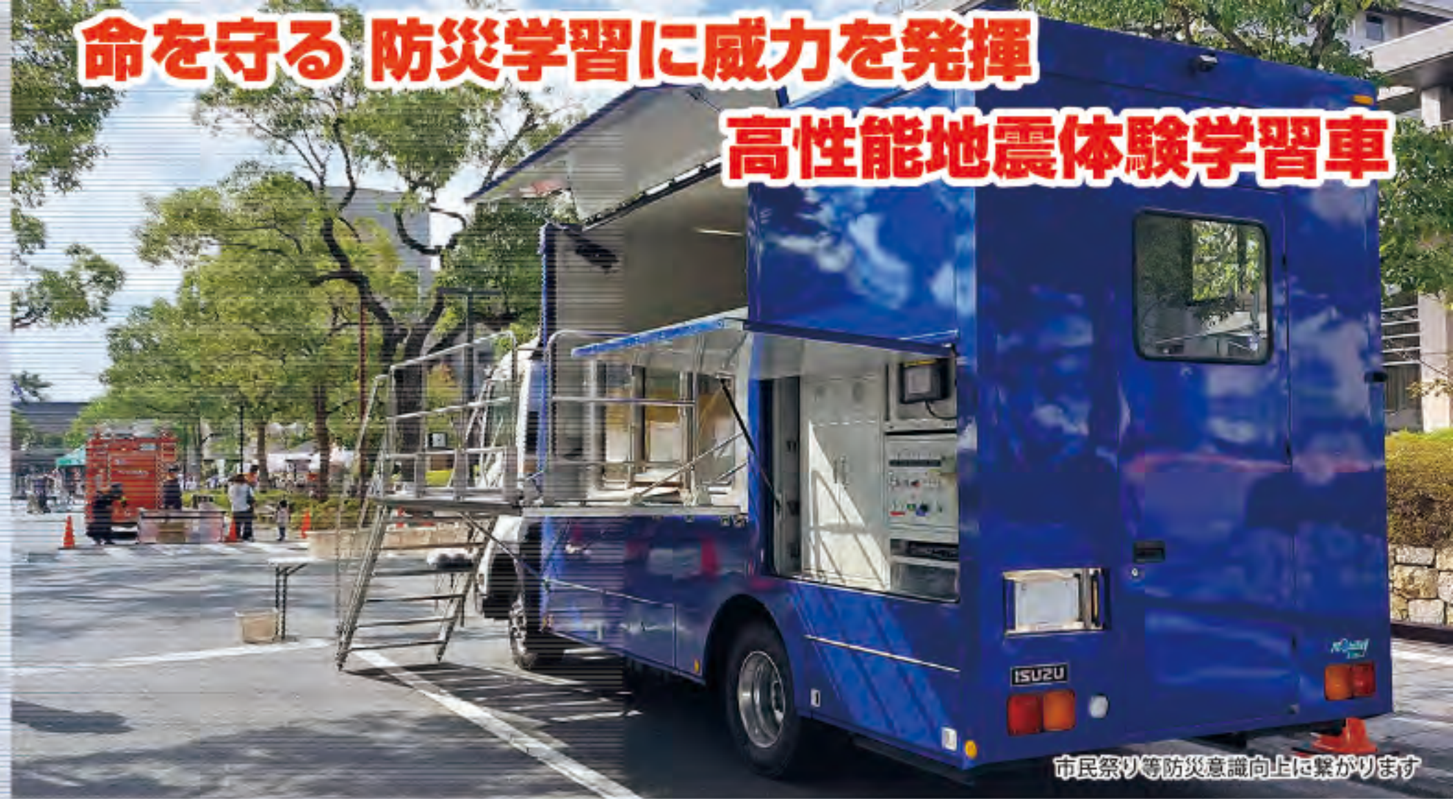
市民祭り等防災意識向上に繋がります