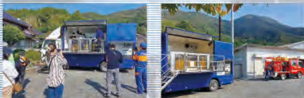
イベント当日はオペレーター+アテンドスタッフで運用いたします