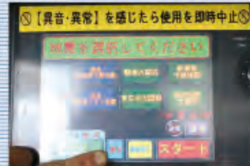
多彩な地震波形を精密再現