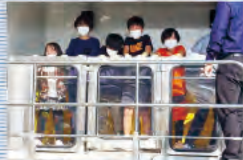
お子様だけでも安全なプログラム選択可能。年齢を問わず学習できます。